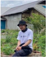
紫波町地域おこし協力隊

福島県出身。大学3年生の春休みにインターンで訪れた紫波町に運命を感じ、2019年6月、大学在学中に会社を設立。2019年10月より紫波町地域おこし協力隊として紫波町に移住。日詰商店街の空き家となっていた古民家を改修し「YOKOSAWA CAMPUS (ヨコサワキャンパス)」という若者の拠点を整備。併設したコーヒースタンドにて日々コーヒーを淹れながらチャレンジしてみたい学生の挑戦を後押ししている。